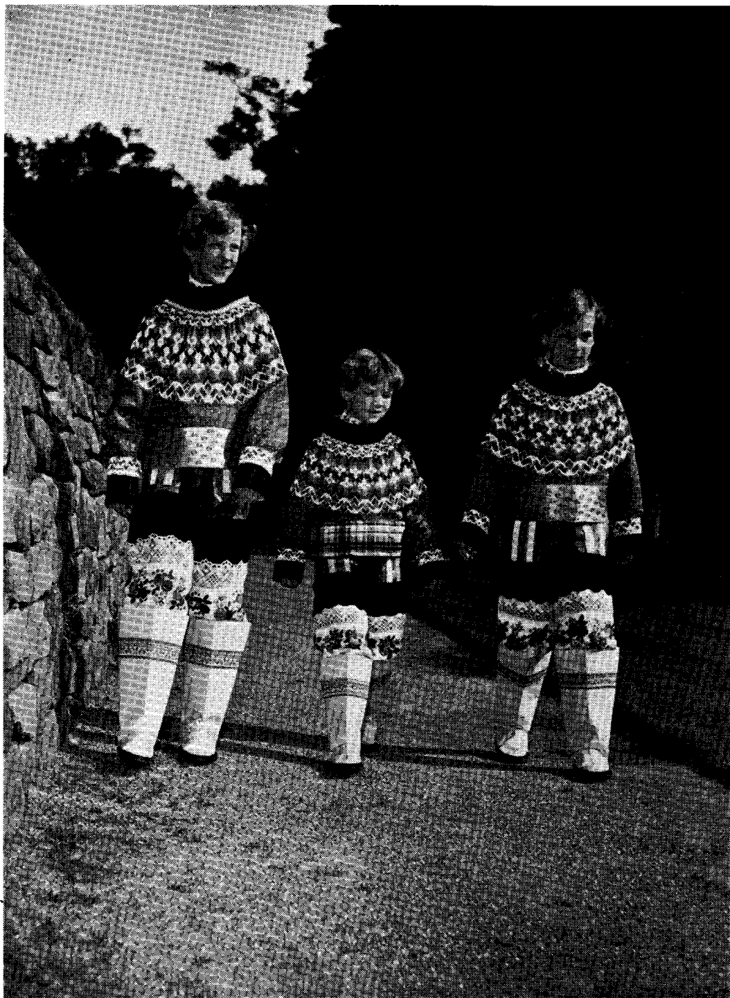
Grønlandernes fornemste gave til kongeparret var de smukke nationaldragter til de tre prinsesser, der i spændt forventning måtte tilbringe sommeren hjemme i Danmark