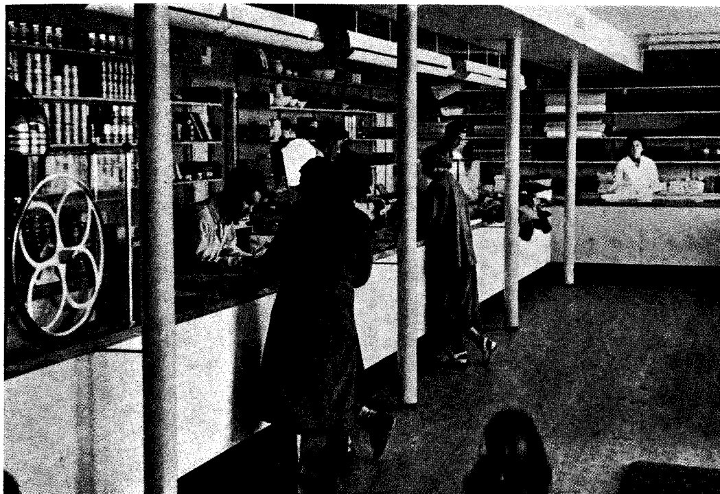
De grønlandske kommuner får deres væsentligste indtægter gennem afgifter på tobak og spiritus, der udhandles i butikkerne, her Julianehåb