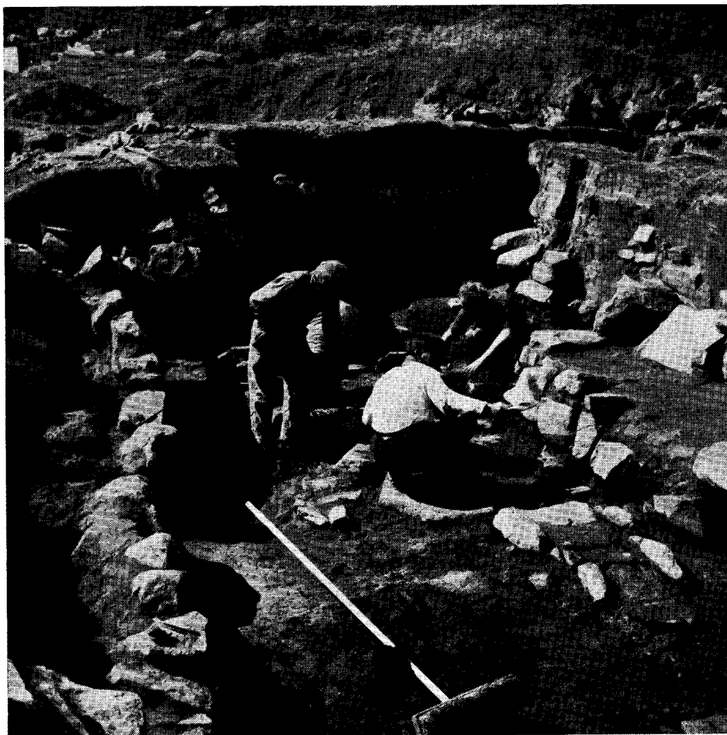
Fra udgravningen af nordbogården 167 i det indre af Vatnahverfi. Billedet viser et stadium under udgravningen af den store stue. Man er igang med afdækningen af gulvlaget, og arbejdet udføres med små graveskeer, koste og pensler. Til højre i forgrunden ses et ildsted — en langild — bestående af en række flade sten, lagt i forlængelse af hinanden, og med en indramning af kantsatte sten

en stor og relativt velbevaret stue, og af særlig interesse her er en ganske lille badstue med rester af badeovnen. Der kan ikke være tvivl om, at denne sidste gård er yngre end den nord for elven. Det kan måske tænkes, at manden på den større gård på et eller andet tidspunkt har skilt jorderne syd for elven fra, og at en søn har bosat sig her.