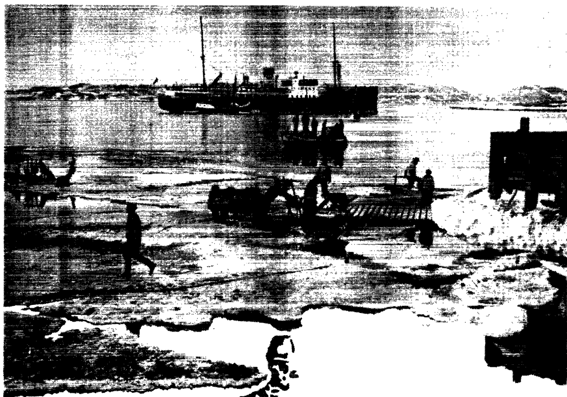
m.s. „Dronning Alexandrine“ ved Kolonien „Egedesminde“ i Grønland