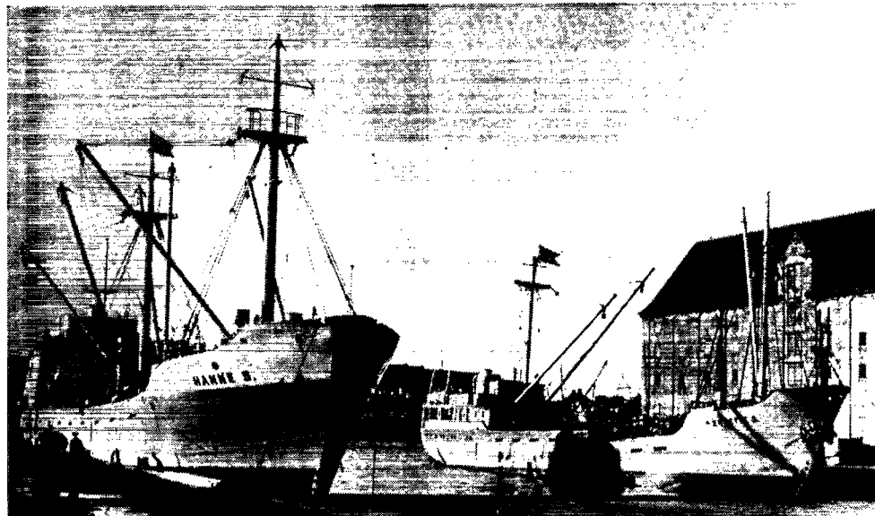
M/S Hanne S. og M/S Annette S. under ekspedition på Grønlandske Handels Plads