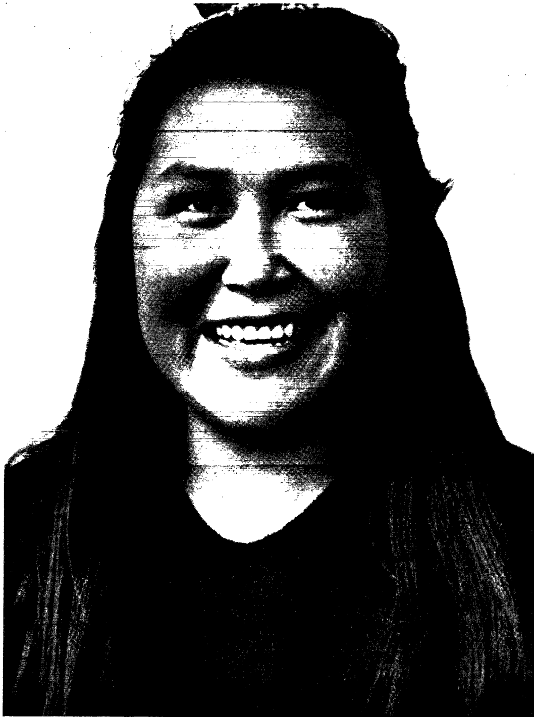
Ung kvinde – fangerkone – og lykkelig for de kår, livet ved Scoresbysund byder hende.