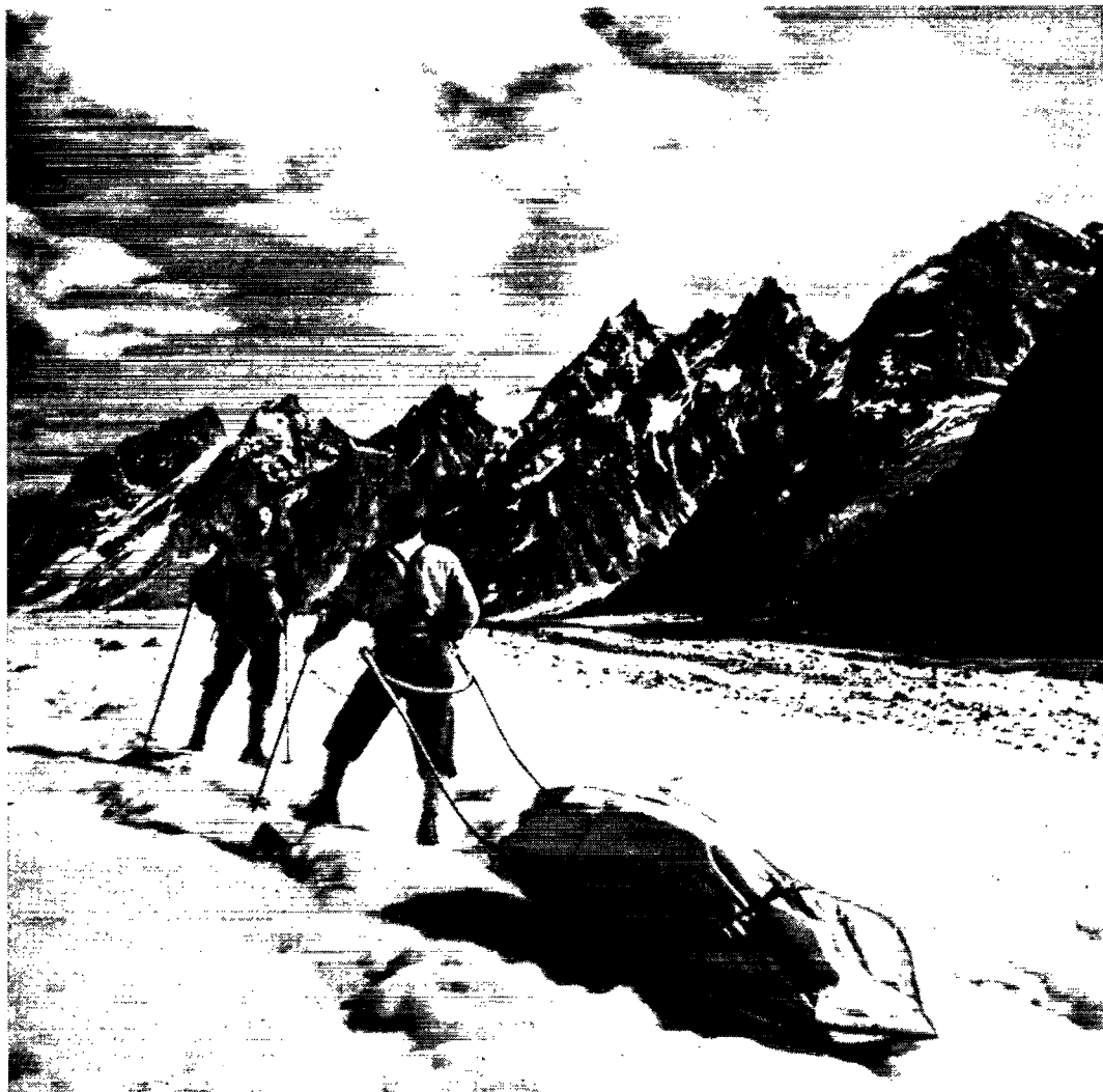
I Østgrønlands storslåede alpebjerglandskab, hvis lige man vanskeligt vil finde andre steder i verden. På vej op ad Vikingebreen til lejr 2.