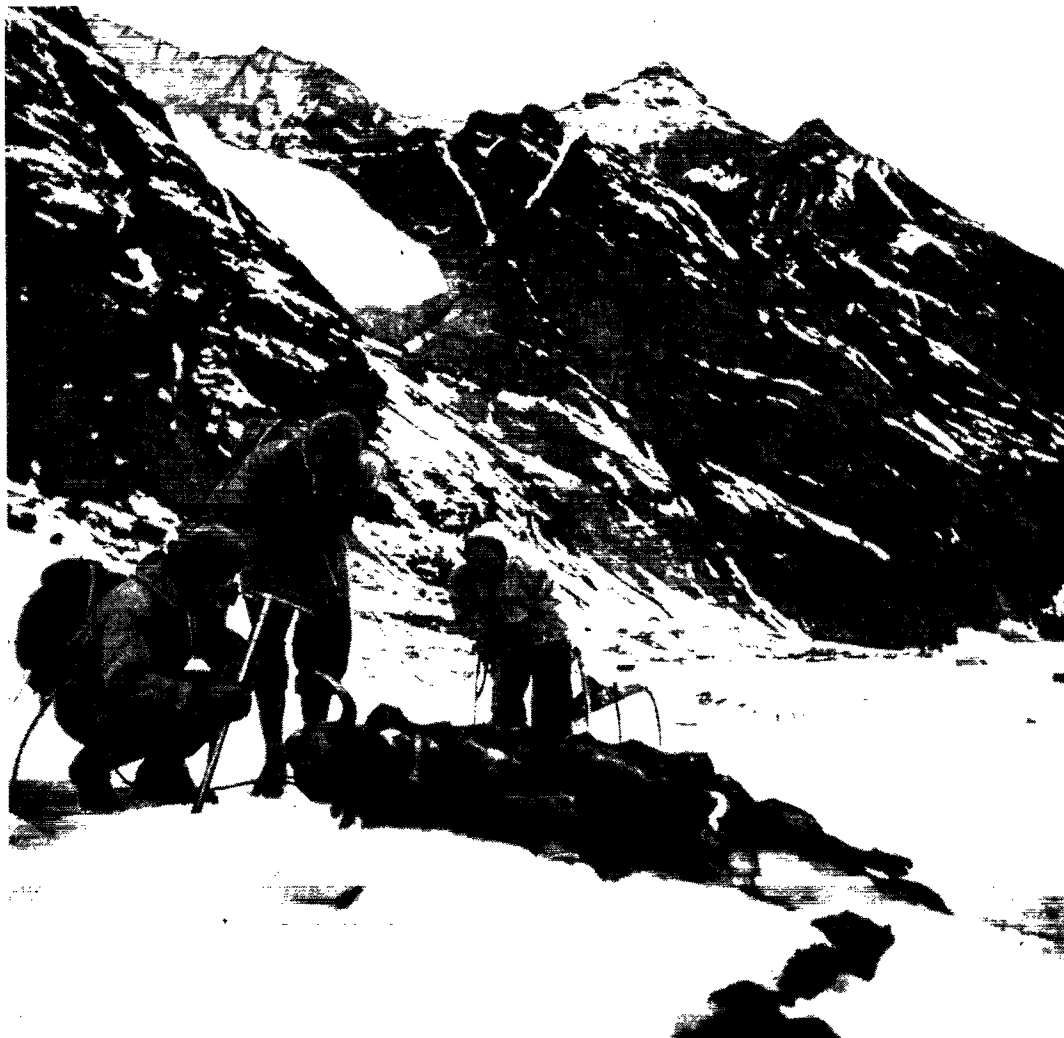
I 600 meters højde stodte bjergbestigerne på en ihjelsultet moskusokse, der var omkommet i den skæbnesvangre vinter 1953-54.