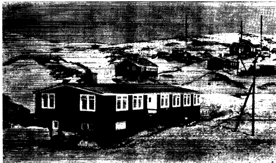
Alderdomshjemmet i Upernavik