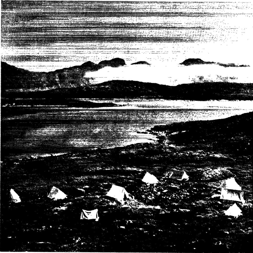
Udsigt over Nordbogården ved Tigssaluk (nr. 15)