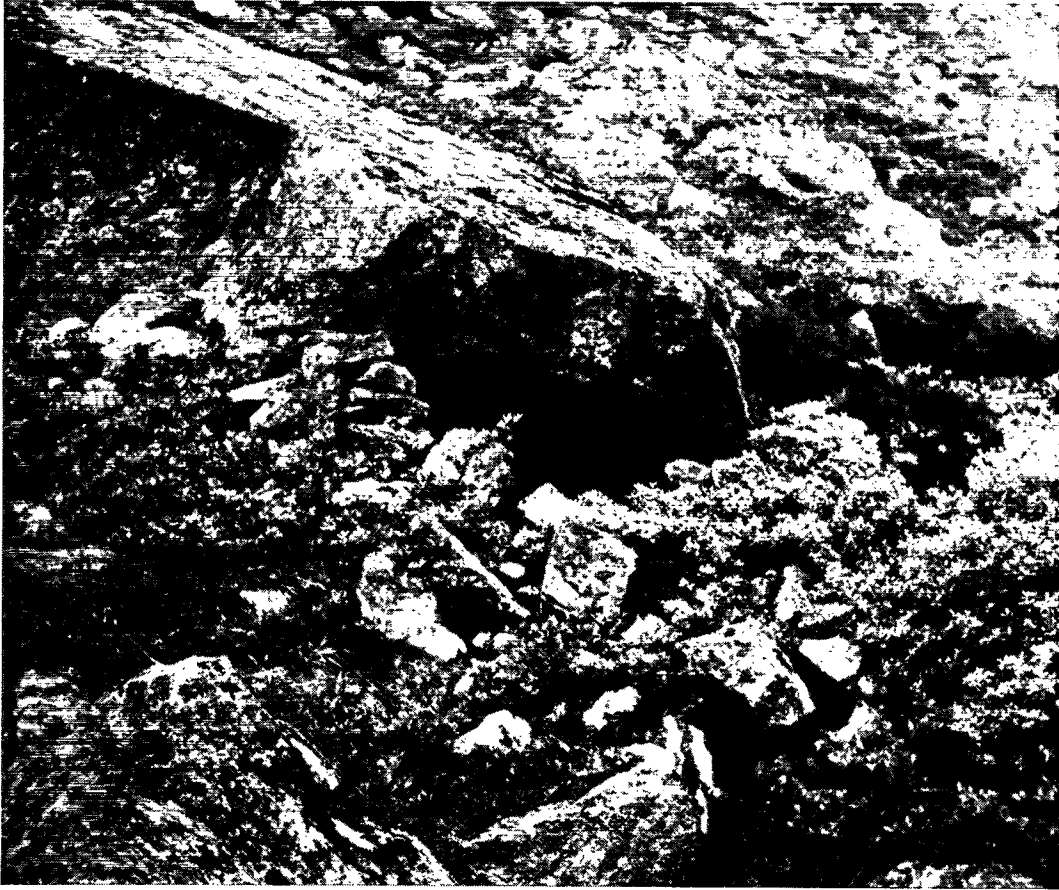
Klippehule, aflukket med en stenmur, antagelig fåre- eller gedefold. Norabogården ved Egoaluit (nr. 10).