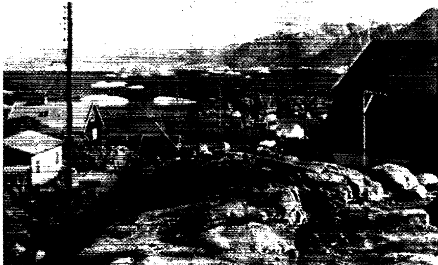
M/S Hanne S. i Umanak