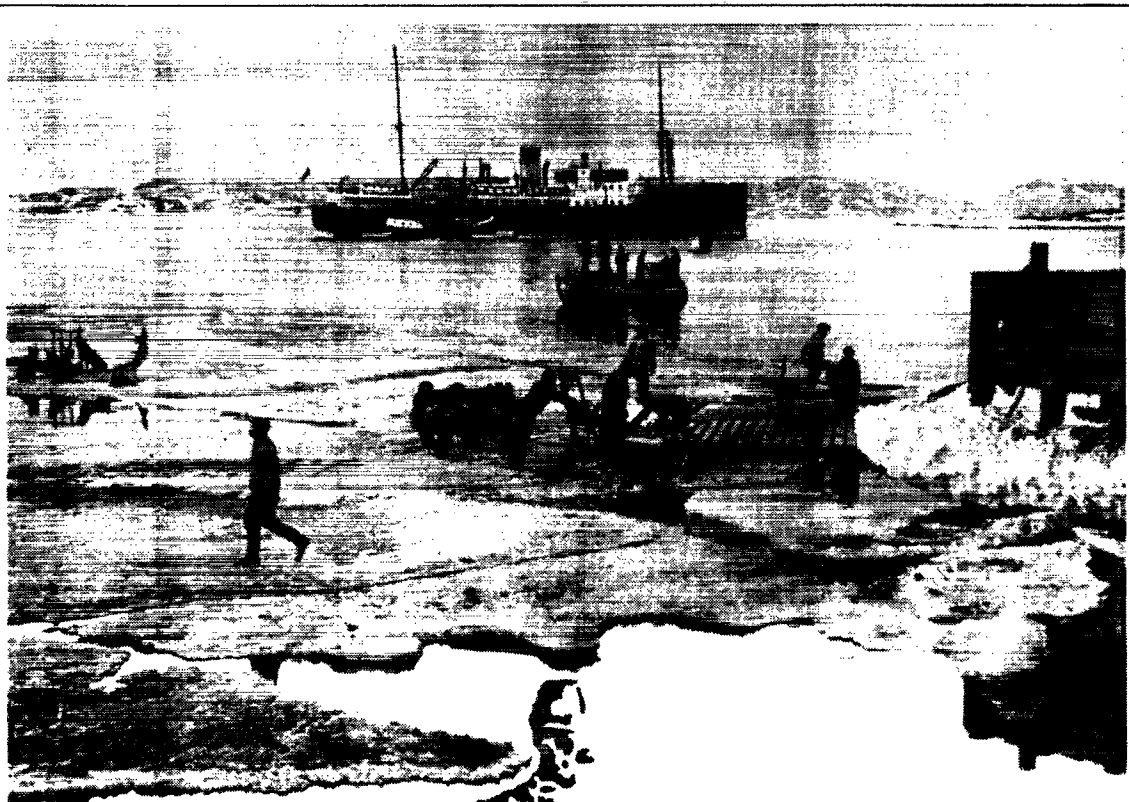
m.s. „Dronning Alexandrine“ ved Kolonien „Egedesminde“ i Grønland