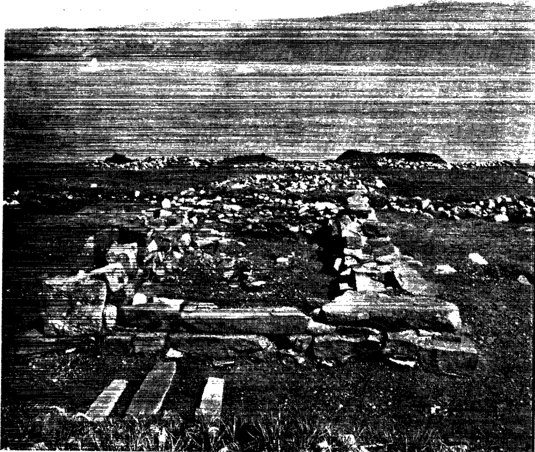
Kirkeruinen på Brattahlid.