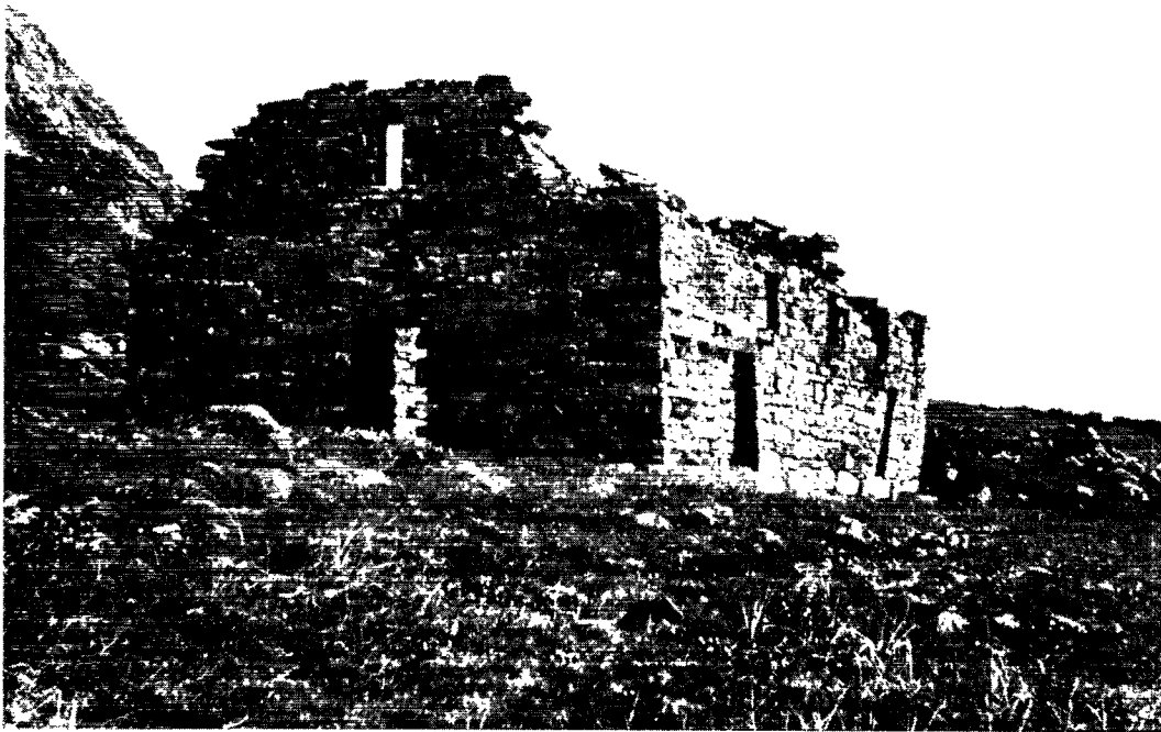
Hvalseð kirkeruin i Qaqortoq ved Julianehåb.

sendtes ned gennem Europa til Rom, blev det tit yderligere decimeret af landevejsrøvere eller af de fyrster, hvis lande man kom igennem, og som krævede deres rigelige „told“.