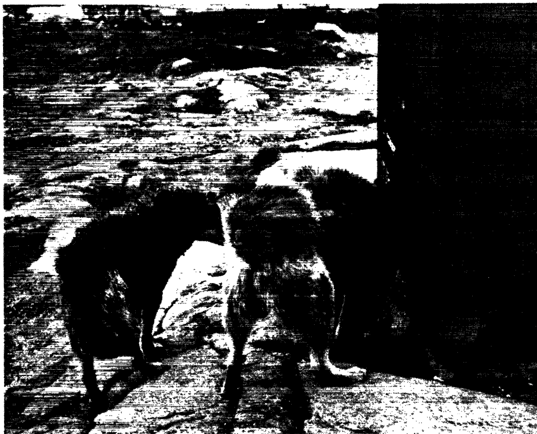
Hundene sørger i udstrakt grad for renovationen. Dette forhold vækker ofte forargelse og opfattes af mange danske som et udtryk for, at hundene sulter. Ved en objektiv bedømmelse må det imidlertid - hvor udelikat det end er - antages, at hundene selv betragter dette tilskud til foderet som en delikatesse.

steder og bopladser, oplysningsarbejde via skoler og præster, udsendelse af tavler og illustrerede tryksager alt med den hensigt, at der vises tilbørligt hensyn til dyr, har i udstrakt grad båret frugt.