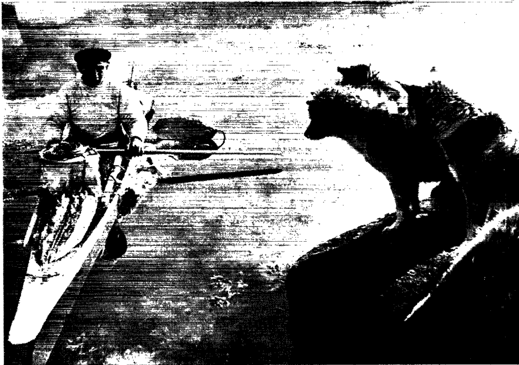
God fangst betyder også ekstra foder til hundene, så fangeren modtages ved hjemkomsten med lige stor interesse af to- som firbenede.

snitslevealderen blandt hundene er lav, 4-5 år, men også fordi slædehundene på Grønland i særlig høj grad lever så nær de naturlige vilkår for en hund, som man vel overhovedet kan tænke sig.