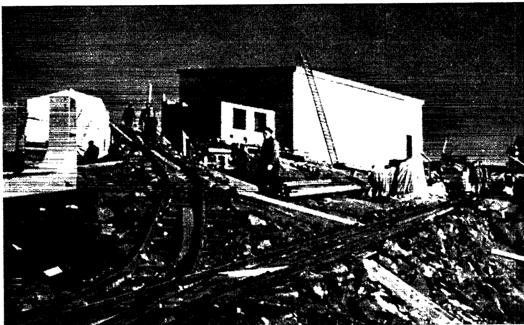
Senderstationen på Kook-berne under opførelsen.

spreder, først og fremmest af det grønlandske. På den anden side må radioprogrammerne naturligvis ikke stivne i det grønlandske, de bør også være formidler af dansk kultur.