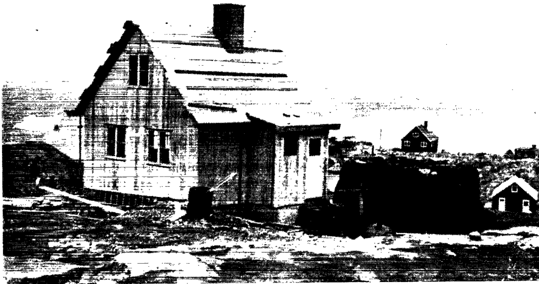
Gammelt og nyt side om side. Ejeren af tørvehuset har fået boligstøttelån, og nu opføres ved siden af hans hytte et moderne træhus, meget større og sundere.

dygtighed, at jeg kan sige, at der ikke findes nogen mere veldrevet institution noget sted. Ved sanatoriet er ansat en overlæge, en overkirurg, som jeg tidligere har omtalt, to reservelæger, en 2. reservelæge og en assisterende læge. Vi står herefter i den situation, som er noget helt nyt i Grønland, at vi er i stand til virkelig at opspore alle tuberkulosestilfælde i starten og praktisk talt omgående iværksætte bekæmpelsesforanstaltninger. Calmettevaccination er gennemført i hele Grønland. Inden sanatoriet kom i gang, har omtrent 1500 patienter været behandlet på sanatorier hernede, hvilket er ca. 6 pct. af hele den grønlandske befolkning. Hjemsendelsen af patienter er nu gået stærkt ned, efter at vi har fået sanatoriet, og forhåbentlig vil den snart være helt forbi, og jeg synes da, at dette er en meget passende anledning til at nævne, hvor taknemmelige vi bør være de hjemlige tuberkuloseinstitutioner for den håndsækning, de har givet Grønland.