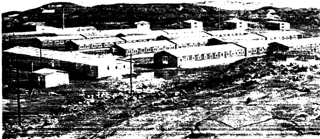
Dronning Ingrid's Sanatorium i Godthåb set fra en af fjeldkammene, der omgiver den store dalstrækning.