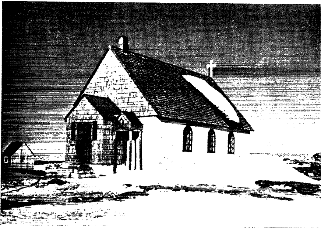
Kirke og skole er i henhold til grønlandskommissionens betænkning blevet skilt fra hinanden, og alle er enige om, at det har været til fordel for begge parter. Her ses kirken i Napassooq, en typisk grønlandsk udstedskirke.

retsproblemer er så indviklede, at landet kan bære juridiske dommere i første instans endnu.