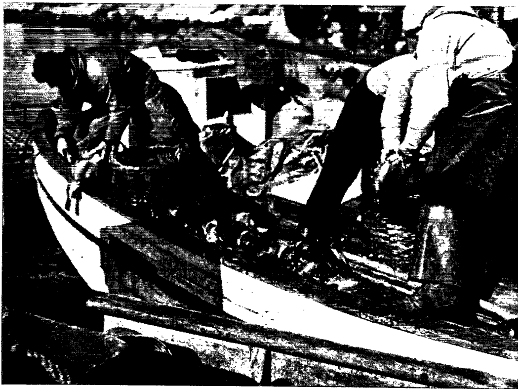
Grønlanderne driver så godt som udelukkende kyst- og fjordfiskeri. Her fanger man stenbidere, hvis rogn bruges til fremstilling af kaviar.

logiske undersøgelser, og hans virksomhed har foreløbig ført til etableringen af Nordisk Mineselskabs bly- og zinkmine ved Mesters Vig, en virksomhed, som lovede godt i de to første år, men nu desværre på grund af de stærkt faldende metalpriser på verdensmarkedet ikke har helt de samme fremtidsudsigter, som man oprindeligt håbede på.