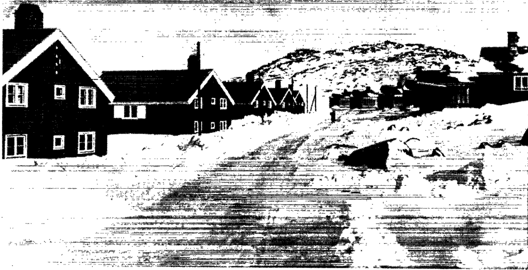
Fra et moderne beboelseskvarter i Godthåb, det såkaldte Østerbro.

selvfølgelig her vælge at sige, at de grønlandske lønninger bør være lige med lønningerne hernede. Dels er det selvfølgelig finansielt udelukket, at man nogen- sinde får bevillingsmyndighederne med på kunstigt at opbygge et særlig højt real- lønniveau i Grønland, dels vil det simpelthen være en ulykke for Grønland, hvis man gør det, og derved gennem tilskud fra den danske statskasse skaber et øko- nomisk klima i Grønland, som ligger betydeligt højere end hernede. Men hvis man da vælger en løn i Grønland, der svarer til lønnen hernede for det samme arbejde, så opstår spændingen imellem de to lønniveauer i Grønland, de udsendes og de hjemmehørendes, idet sådanne to lønniveauer selvfølgelig, hvor mange for- nuftige argumenter der end kan opstilles for dem, dog altid vil være grobund for en letkøbt agitation. Dertil kommer noget helt andet, nemlig vanskelighederne ved at fastsætte en ligeløn i Grønland og Danmark. Hvad vil det sige at have den samme realløn i Godthåb og i Assens? Vi kan dog aldrig sammenligne de naturlige goder, som Godthåb og Assens byder sine beboere, eller ophæve den kendsger- ning, at det - alt andet lige - tager flere kul at opvarme et hus i Godthåb til de samme varmegrader som et hus i Assens. Alle disse problemer har vi kæmpet med de forløbne år, og der findes ikke nogen patentløsning, der tilfredsstiller