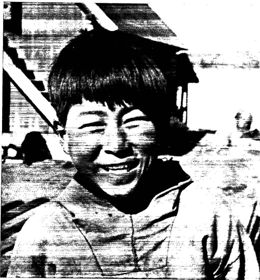
Grønlands børn kan i dag tage en realeksamen i Godthåb, som er ganske ligestillet med realeksamen i det egentlige Danmark.