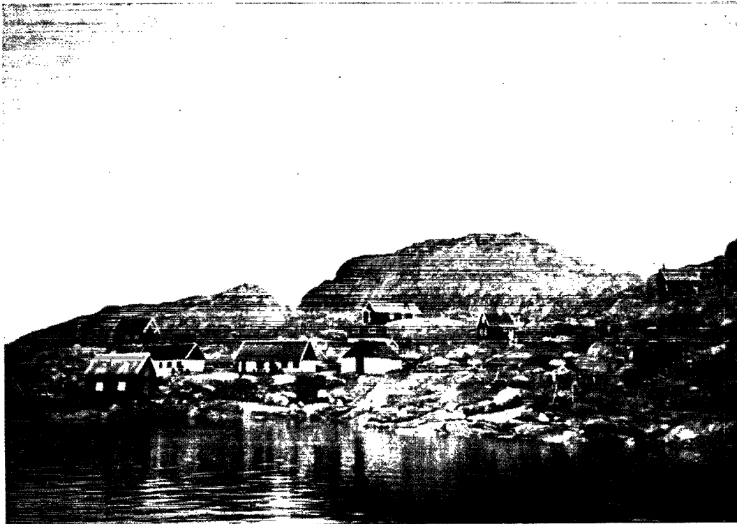
Postindleveringsstedet Augpilagtog pr. Upernavik.