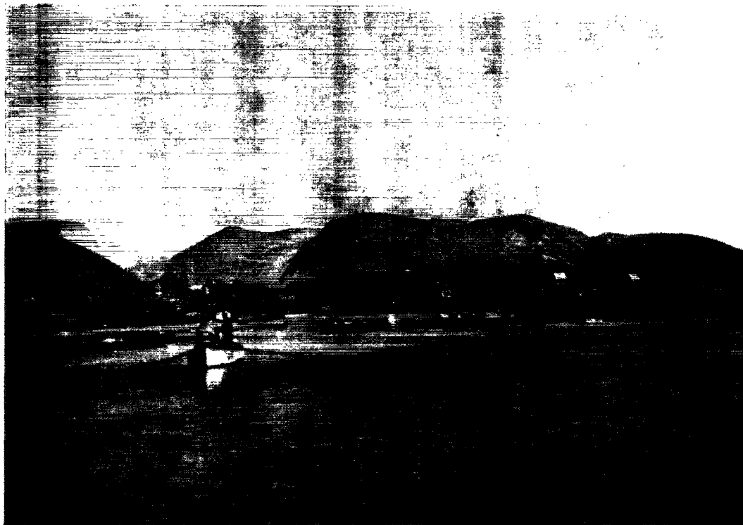
Postindleveringsstedet Sarqaq pr. Jakobshavn.