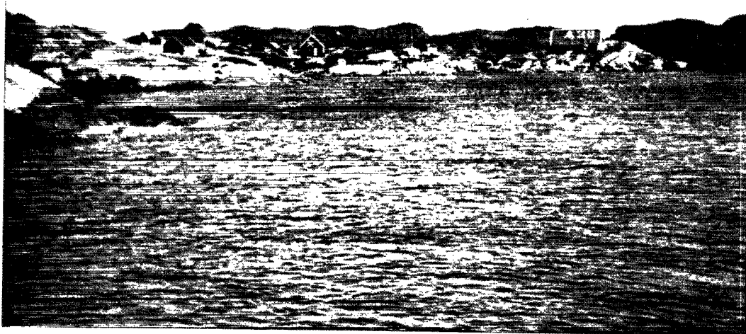
Postindleveringsstedet Qagssimiut pr. Julianehåb.