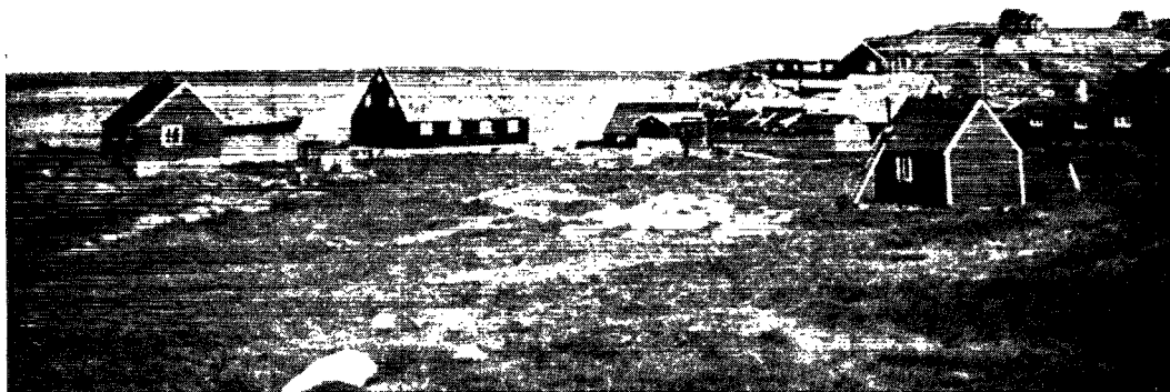
Postindleveringsstedet Claushavn pr. Christianshåb.