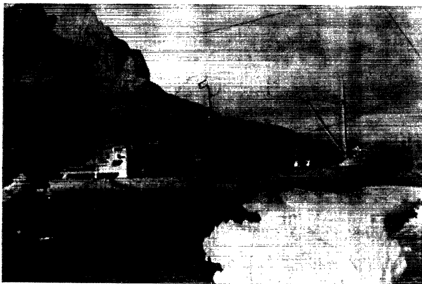
M/S »HANNE S« i Umanak