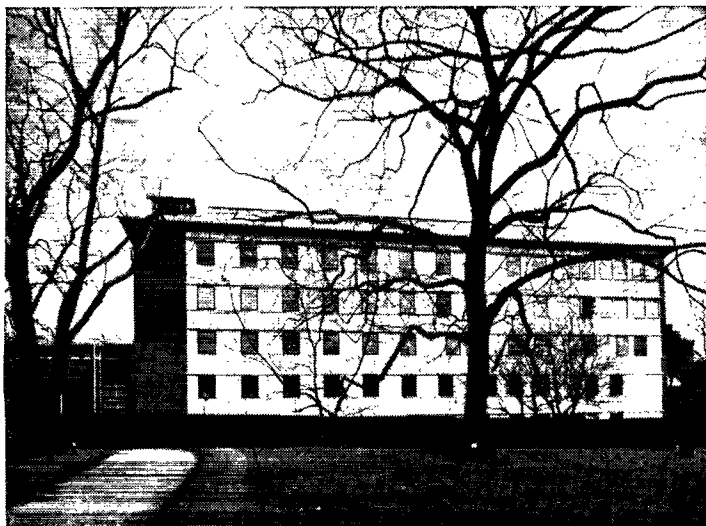
Biologisk Institut, Botanisk Have. Arkitekt, kgl. bygningsinspektør K. Gottlob.