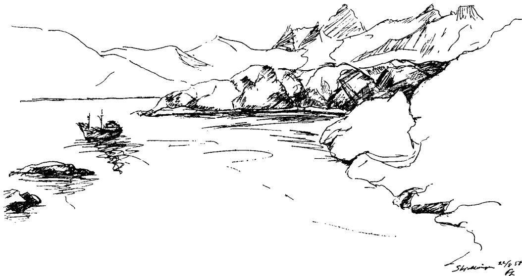
„Britannia“ for anker ved Skjoldungen.

pakke ud og ind. Distriktslægen får i god tid besked om den forventede ankomsttid, så han i tide kan samle alle de patienter, han ved, trænger til behandling. Samtidig meddeler man gennem opslag i byen og gennem radioen stedets befolkning, at øjenlægen træffes på sygehuset. Undersøgelse, behandling og medicin er gratis, hvad der iøvrigt gælder al lægebehandling i Grønland, og enhver, der ønsker det, bliver behandlet. Alle resultater drøftes med lægen og indføres i hans journaler. Han fører kartotek over hele befolkningen og har på den måde fuldstændig oversigt over sundhedstilstanden indenfor sit område. Man fortsætter, så længe der er patienter, hvorefter turen går til udsteder og bopladser.