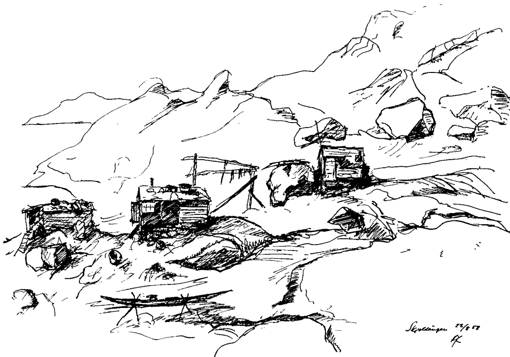
Saneringsmodne huse i Skjoldungen.

af risiko er svært at forstå for den, der herhjemme blot behøver at tage sin telefon for at rekvirere læge og ambulance.