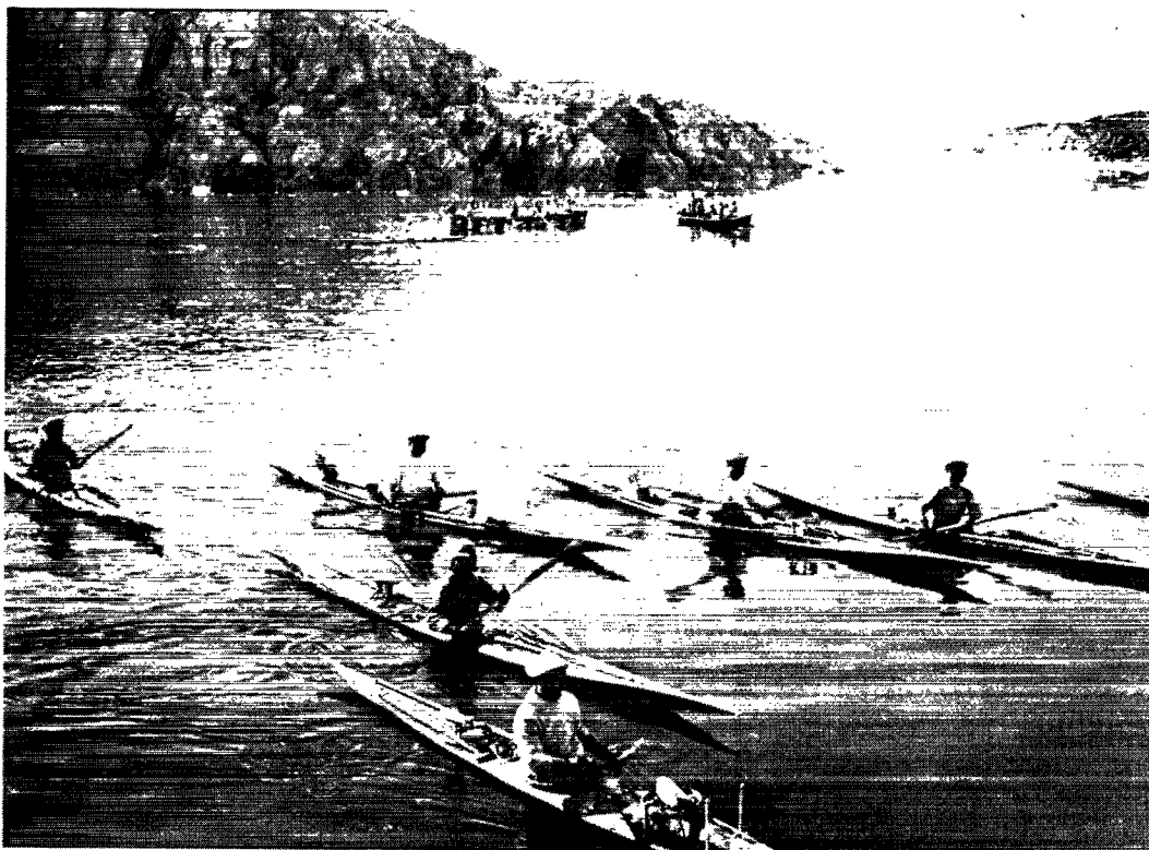
Kajakker og konebåde ved Angmagssalik.