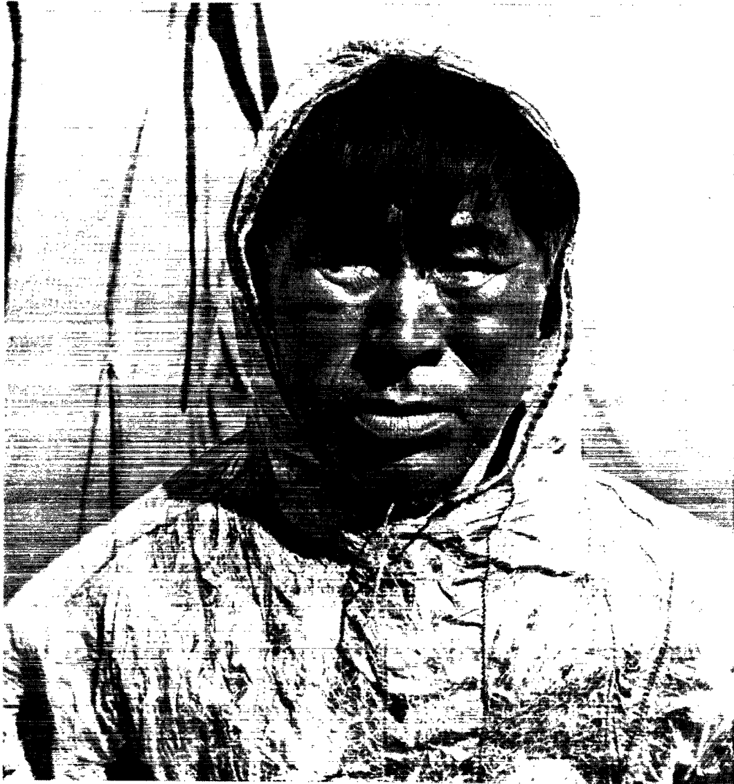
Eskimo i tarmskindspels fra Point Hope i Alaska.