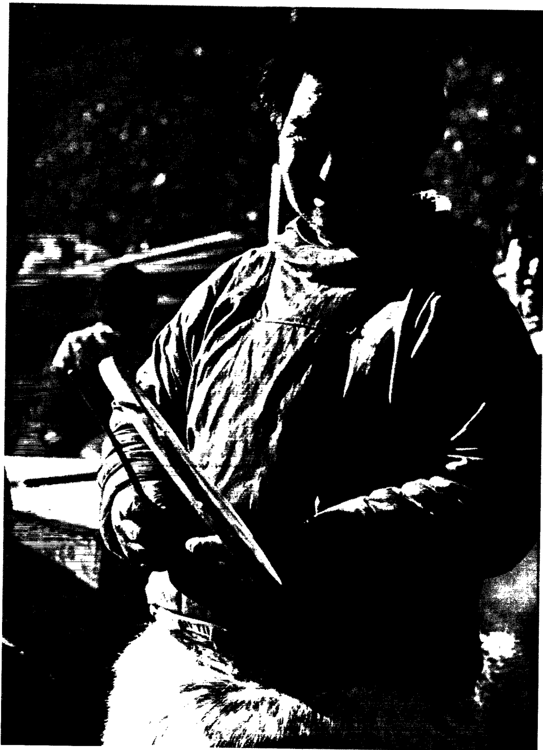
Inukitsorsuak vil danse en trommedans for gæsterne.