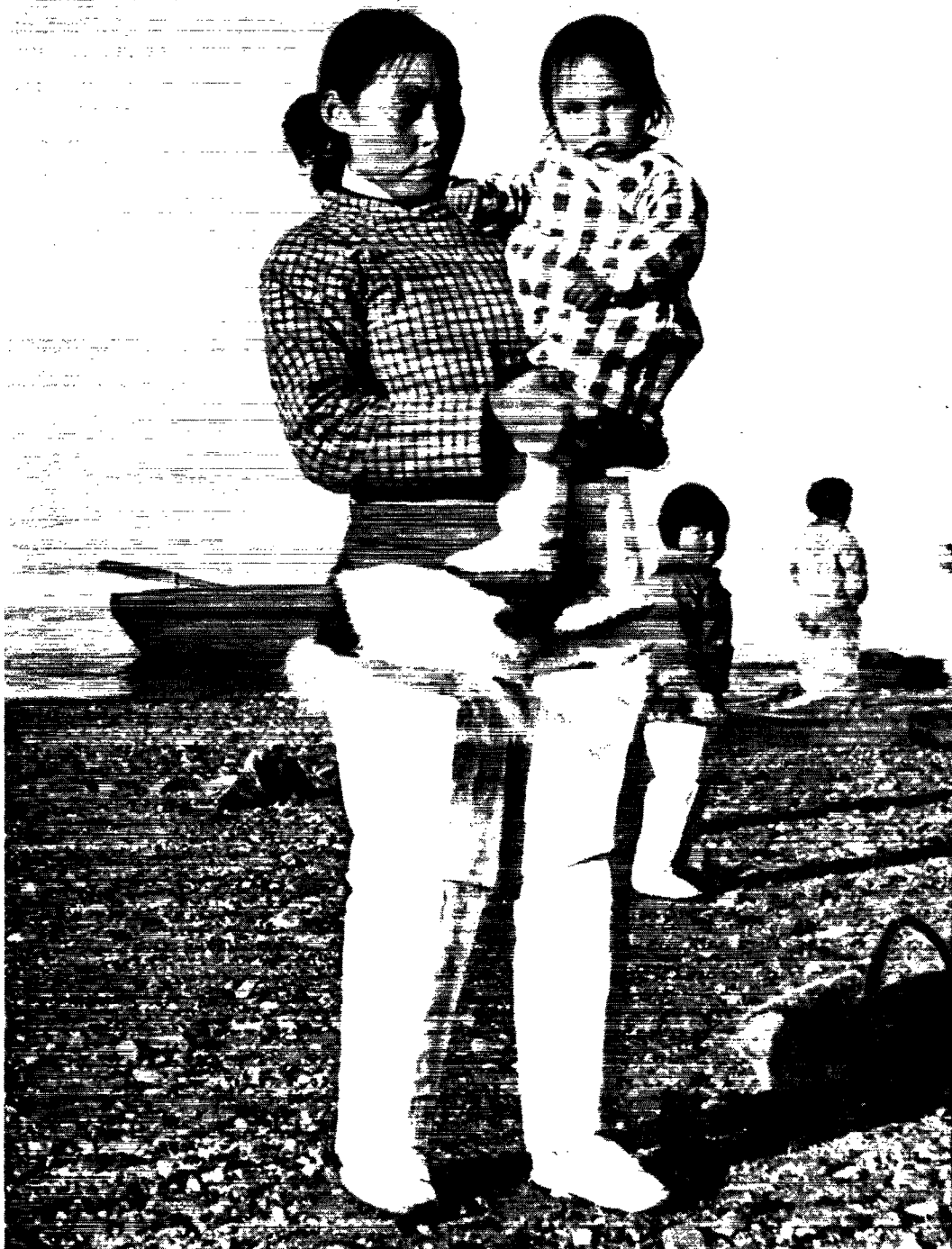
Inutaq i pinsesnit på strandbredden ved Siorapaluk.