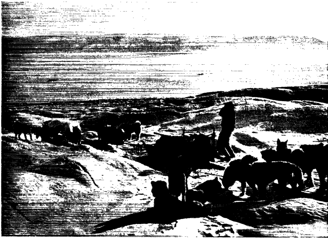
På vej ned fra indlandsisen ved Politikens Bræ - Nassaq mærker optræk til storm.