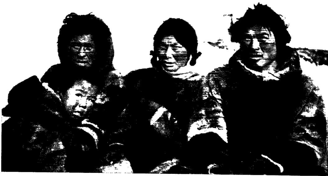
Netsilik-kvinde med sine to mænd.