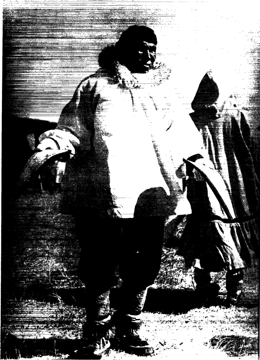
Bådejer, umialik, uddeler hvalhud, mattak, ved festen i anledning af hvalfangstens afslutning i Point Hope, Alaska.