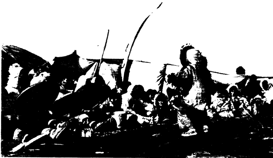
Trommedans i anledning af hvalfangstens afslutning i Point Hope, Alaska.

Eskimoernes ganske enkle samfundsordning giver dem en frihed, som ikke overgås af noget andet folk i verden. Udover forpligtelserne overfor familien lægger samfundet ingen bånd på dem. De kan flytte, hvorhen de vil, og når de vil, og de kan slå sig ned og blive optaget i hvilket som helst andet eskimoisk samfund. Ingen vil bestride deres ret til at fange, hvor de vil, for fangstdyrene tilhører ingen eller dem allesammen. Sluttes de sig til et lille samfund følger dog visse forpligtelser med, nemlig at de af større fangstdyr må afgive ganske bestemte dele til bopladsfællerne, ligesom det også er velset og almindeligt, at man er rundhåndet og giver fangstparter af mindre fangstdyr, særlig til dem der af skæbnens ugunst ikke har noget. Det gør man gerne, for fangststykket kan hurtigt skifte, så man selv en dag vil være glad for at få et stykke kød af naboen. Der kan også være en anden grund til at være gavmild. En Alaska-eskimo gav mig engang noget sællever, som han nægtede at modtage betaling for med den begrundelse, at jeg jo ikke selv kunne fange sæler, og fangstdyrene havde ikke noget imod at lade sig fange af en mand, der var gavmild og tænkte på dem, der ingenting havde.