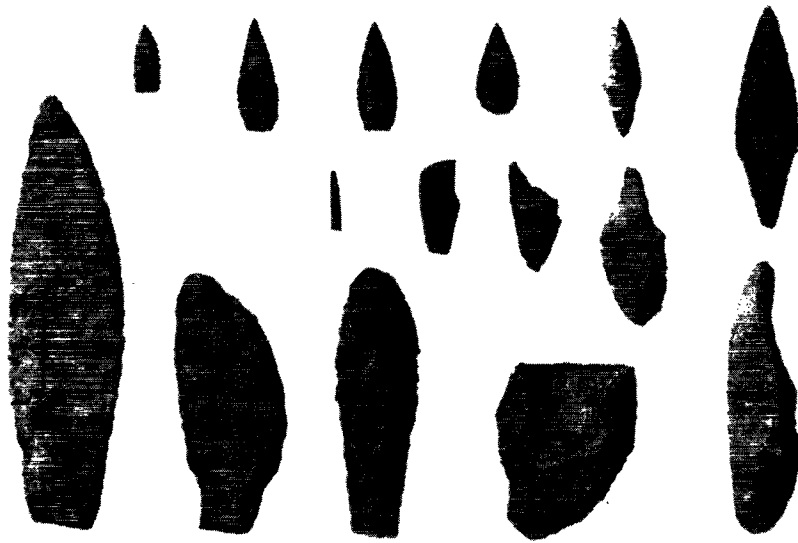
Redskaber af sten fra Vestgrønlands ældste kultur, den 3000 år gamle Sarqaq-kultur. I anden række 3 stikler.

inde i landet. Senere arkæologiske fund har bevist, at de virkelig også holdt til i indlandet.