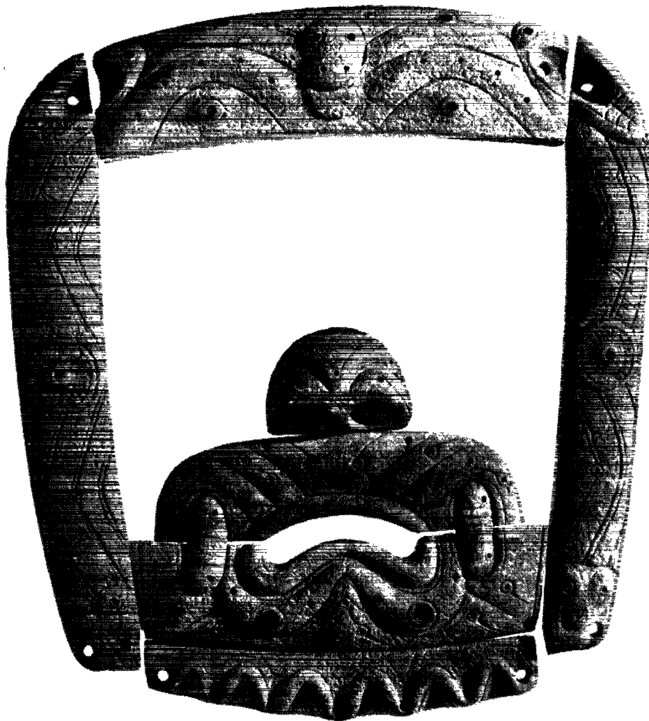
Gravmaske fra Ipiutak-kulturen udskåret af hvalrostand.

hovederhverv, forsvandt den efterhånden fra canadisk område, muligvis fordi hvalerne trak væk. I Grønland bredte den sig både sydover langs vestkysten og til Østgrønland. Hvalfangsten var et langt stykke tid et vigtigt erhverv, men sælfangsten tiltog i betydning i takt med en stærk udvikling af kajakfangstteknikken, og kulturen fik efterhånden et særlig grønlandsk præg. Nogen radikal ændring skete der dog