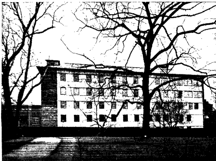
Biologisk Institut, Botanisk Have.

Arkitekt, kgl. bygningsinspektør K. Gottlob.