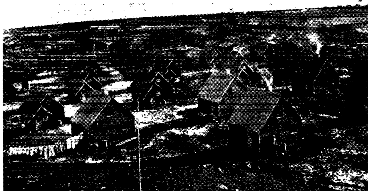
Statslånhuse for grønlandske arbejdere ved kulbrudet i Qutdligssat.