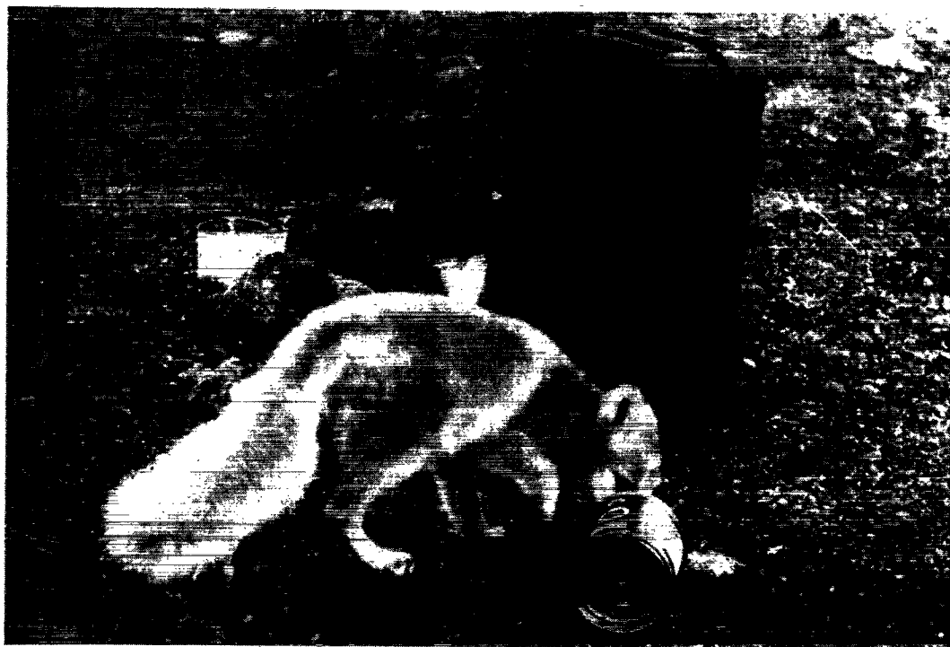
Det kan volde vanskeligheder for en ræv at rejse en konservesdåse på ret køl.

der er typisk for dette vidtstrakte lavland. Mens jeg der sad i et lille observations-telt og iagttog en rødstrubet lom, der kun nogle få meter foran mig lå på en mostue på søbredden og rugede sine æg, blev jeg gentagne gange opmærksom på en blåræv. Med næsen tæt over jorden kom den løbende og afsøgte planmæssigt hele søbred-den. Bag hver sten og i enhver fordybning havde den noget at gøre. Ind imellem blev den stående, løftede hovedet og snusede i luften. Dens flittige søgen gjaldt sandsynligvis – således troede jeg i begyndelsen – de små lemminger, hvis spor jeg ofte havde fundet i det fine sand på søbredden. Mit skjul, og dermed også lommens rede, plejede ræven, når jeg opholdt mig i teltet, at gå udenom i en stor bué. Alli-gevel troede lommen ikke denne rutinerede ægrøver over en dørtærskel, og allerede når den fik øje på den på lang afstand, strakte den halsen ud over redekanten for ikke at fremkalde unødigt opsigt.