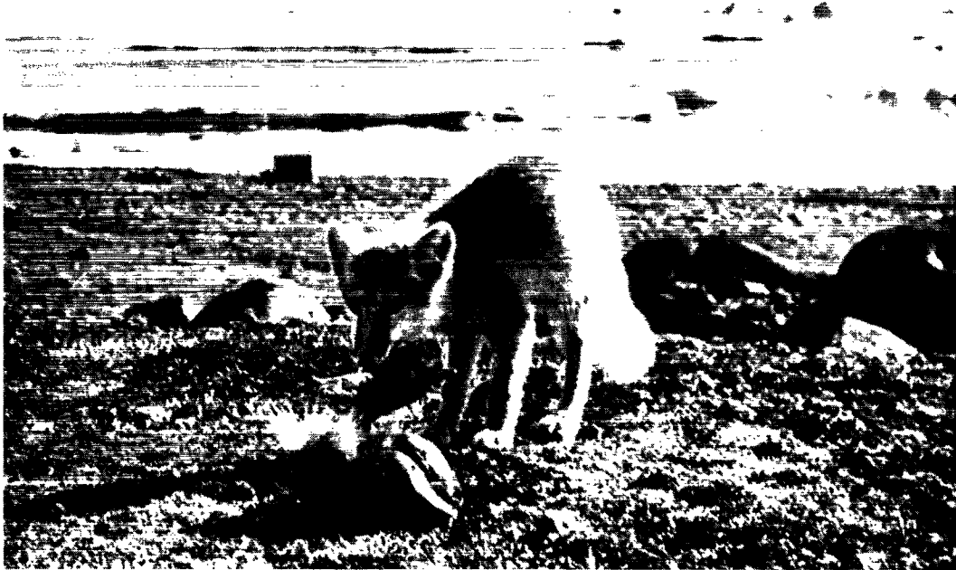
Gammel hvidræv ved et ådsel på ishavskysten.

Der måtte tages alle tænkelige midler i anvendelse for at værges sig imod de allestedsnærværende rovdyrs grænseløse frækhed endog for at afholde dem fra at æde af de syge, endnu før døden havde befriet disse fra deres lidelser. Den omstændighed, at det var en ø, hvorfra rævene, der forbigående må have levet under særdeles gode forhold og formeret sig stærkt, ikke har kunnet komme bort, har sandsynligvis været medvirkende til deres eksemPELLØSE påtrængenhed, skønt noget lignende aldrig er blevet oplevet andre steder. At denne lille røver kan blive ganske ovenud fræk, når der ikke lægges den hindringer i vejen, kan man dog også opleve i Grønland.