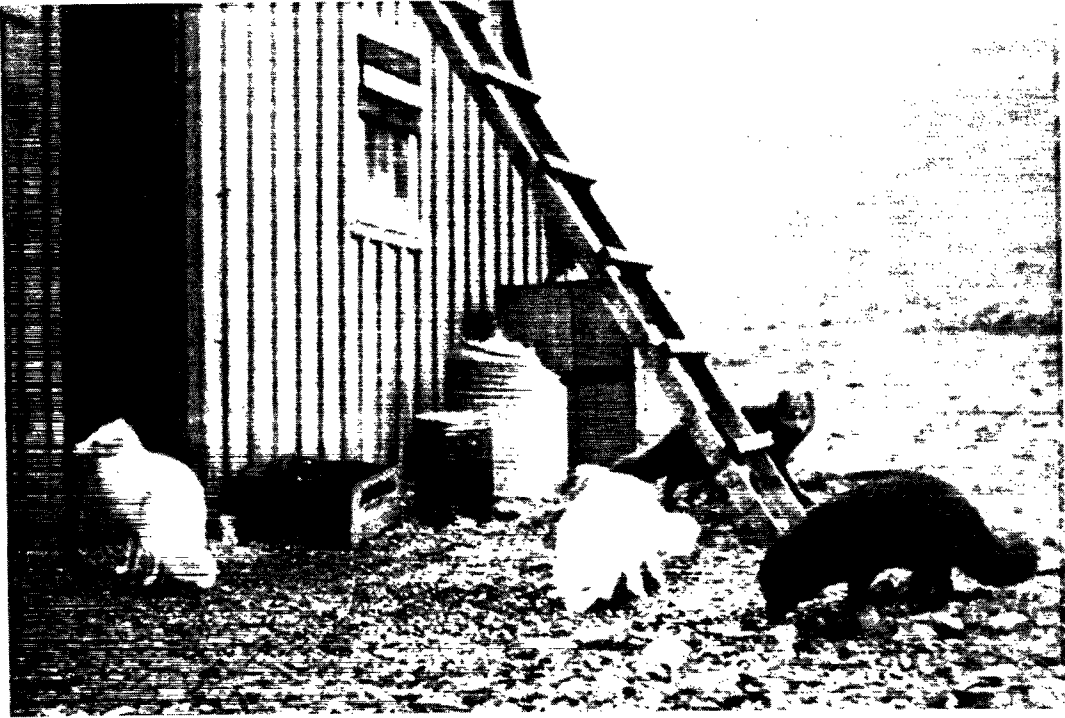
Regelmæssig hver aften afsøgte disse polarræve pladsen foran ekspeditionshuset og stod derefter ventende udenfor døren.

Vi havde efterhånden vænnet os til at have denne sværm af utrættelige rovdyr som vore ubudne gæster omkring os, da det en dag ganske uventet gik galt. Vi havde alle begivet os ud på en jagtudflugt til det indre af landet. De fleste af rævene var i begyndelsen fulgt efter os, som de plejede at gøre det, men da de så, at turen førte dem for langt bort, forlod de os, ligesom tilfældigt, den ene efter den anden for at vende tilbage til hytten. Da også vi, sent om aftenen trætte og sultne kom tilbage, ventede der en ikke helt almindelig overraskelse på os. Da vi åbnede døren, vrimlede det med ræve i hele hytten. De sad på og under briksen, på komfuret og i gryderne. Bortset fra konserves fandtes der ikke en stump spiseligt mere i hytten; alt havde rævene ædt. Synligt skræmte blev de ikke, da de så os træde ind i hytten; de tog det åbenbart som en ganske naturlig ting, at de endelig havde fået opfyldt deres ønske. Det viste sig senere, at vinduet ikke havde været forsvarligt lukket . . .