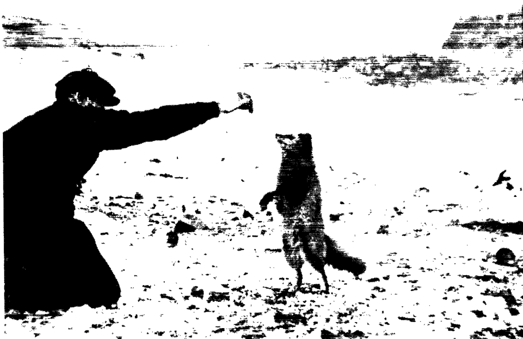
Så tam kan polarræven blive i løbet af kort tid, når der ikke lægges den hindringer i vejen.

skade, og kort efter på et lignende sted læderhandskerne. Disse var dog så medtagne, at de ingen værdi havde for os mere.