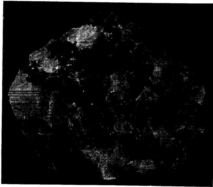
RÅKRYOLIT FRA IVIGTUT