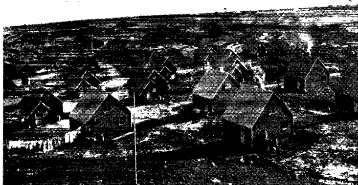
Statslånhuse for grønlandske arbejdere ved kulbrudet i Qutdligssat.