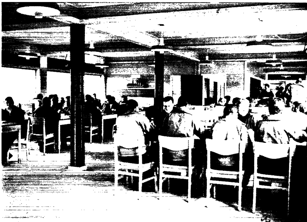
Udsnit af kostforplejningen.