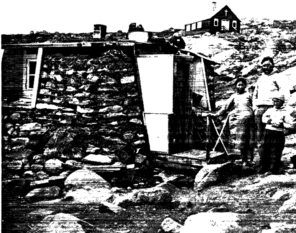
Det nye hus i Kuødlorsuaq. Bemærk det nye skolekapel i baggrunden.