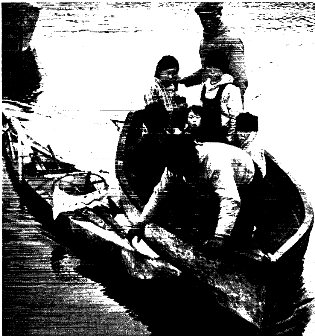
En flytterfamilie forlader Tasiussaq.