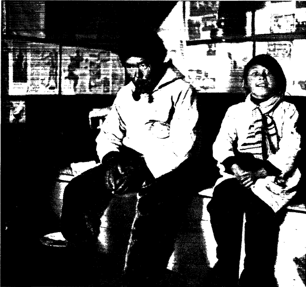
Aron ville ikke flytte og forblev i Kuwdlorssuaq.