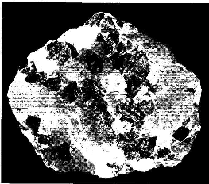
RÅKRYOLIT FRA IVIGTUT