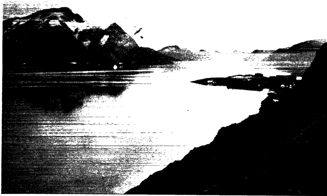
Fjorden »Qórnoq Svudlua« (Qórnoqs blæsehul). Umiddelbart under krydssets nederste arm på siden af Qingâq-fjeldet (Godthåbsfjordens næsthøjeste, 1616 m) skimtes det formodede »Horna-«, her blot set nordfra.

vært sterkt interessert i å bringe de norrøne grønlandingers skjebne på det rene. De har reist omkring sammen med eskimoer og undersøkt ruiner, gravd og spurt, og faktisk lært opp en del eskimoer til å bli „nordbo-minded“.