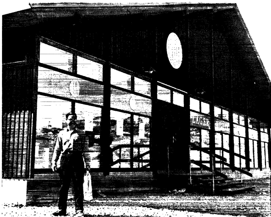
Grønlandsk selvbetjeningsbutik under Den kongelige grønlandske Handels mærke.