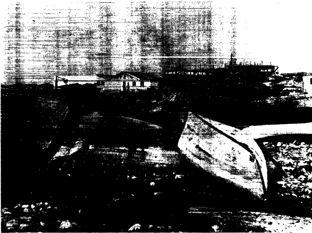
Grønlandske småjoller i Godthåb.