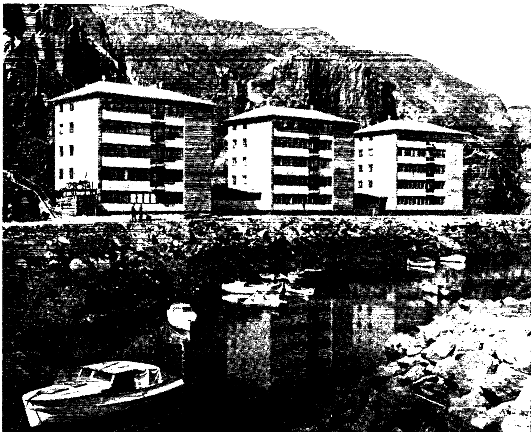
Huse i Sukkertoppen – de kunne have ligget i Brønshøj.