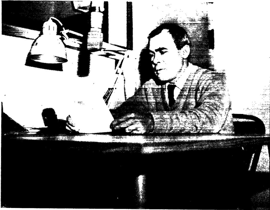
Selvom Radiofonis nye kortbølgesender har gjort lytteforholdene i Grønland en del bedre, er det dog stadig flere steder svært at høre Radioavisens udsendelser. Her er redaktøren af Radioavisen i gang med oplæsningen.

slaget. Det drejer sig om installationen af en såkaldt RTT-skriver. Det er, populært sagt, en fjernskriver, der modtager rundspredte fjernskrivertelegrammer. De fleste store telegrambureauer har en sådan tjeneste. Fra stationer placeret i Europa og Amerika udsendes signaler, der ved hjælp af en radiomodtager, som gennem en converter er koblet til en fjernskriver, fremkommer som almindelige nyhedstelegrammer, overalt hvor der er opstillet et modtager-system. Man har allerede i Godthåb gennemført – ved venlig assistance fra Televæsenet – en flere ugers forsøgsrække, der viser at systemet vil kunne fungere tilfredsstillende, og det kan i øvrigt videre oplyses, at tilsvarende installationer findes på de to amerikanske forsvarsanlæg i Grønland.