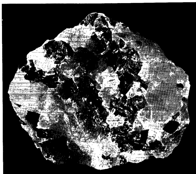
RÅKRYOLIT FRA IVIGTUT