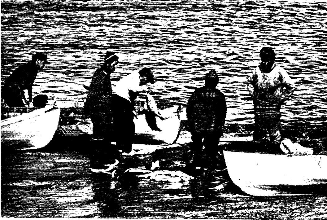
Hvad med os, siger fiskerne.

fiskere i småbåde omkring det store fartøj spørger: „Hvad med os?“. Men vi må igennem denne udvikling i Grønland også trods de tegn på modvilje, der i dag vises.