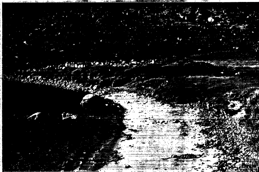
Herjolfsnæs kirkeruin set fra sydvest. I nordbotiden lå landet noget højere, og kysten var længere ude, men på grund af landsenkningen har havet trængt sig frem på landets bekostning.

Eftersom Herjolfsnæs i lige så høj grad som Gardar og Brattahlid er velkendt i Grønlands og Nordens historie, er det meget sørgeligt, at stedet skal henligge i upåagtethed. For fremtidens turister vil Herjolfsnæs være et selvfølgeligt mål, men i øjeblikket er stedet ikke særlig heldigt at fremvise. En udgravning og nænsom restaurering af ruinerne samt flytning af nyere bebyggelse vil derimod gøre det til et sted, hvor forskellige afsnit af Grønlands historie vil være synlige for den besøgende. På et enkelt afgrænset område vil man kunne fremvise rester af en af nordbotidens kendte kirker, nogle andre nordbobygninger, tomter af et par eskimohuse samt fundamenter af kolonisationstidens bygninger.