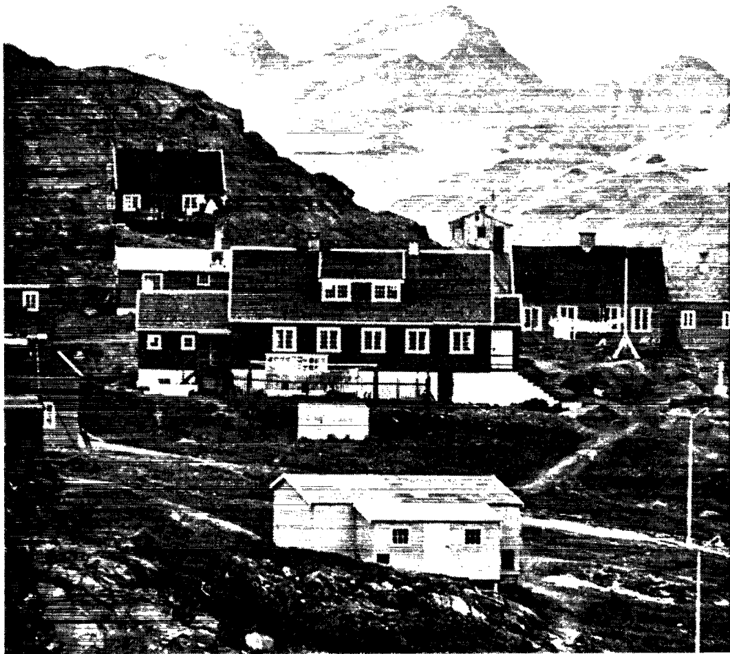
Den nuværende handelschefbolig og ved siden af det gamle sygehus.

Angmagssalik-området, og hvor der efter hvad der blev fortalt mand og mand imellem skulle være så mange sæler, at man omtrent kunne tage dem med de bare næver. De første år, folkene boede dernede, var der gode fangstforhold, men efterhånden kom der mange og lange perioder med misfangst, og i 1942 rejste halvdelen af udflytterne tilbage til deres gamle bopladser, og senere er de sidste udflyttere fra Skjoldungen kommet tilbage til hovedområdet.