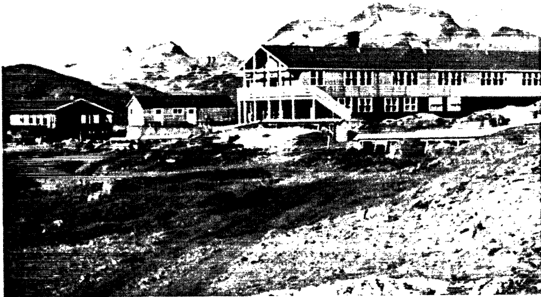
Angmagssaliks nye sygehus.

indførtes almindelig valgret, inspektøren, lægen, præsten og skolelederen var faste medlemmer af rådet, og der valgtes yderligere indtil 14 medlemmer. Den tjenstgørende inspektør var formand for rådet. Endelig udvidedes loven om Grønlands Landsråd og de grønlandske kommunalbestyrelser den 1. januar 1963 til også at gælde i Øst- og Nordgrønland, og der valgtes ved almindelig valgret en kommunalbestyrelse på 9 medlemmer, som ud af sin egen midte valgte en formand. Begrebet „fødte“ eller „faste“ medlemmer af rådet bortfaldt. Hermed var de 2 særlige områder Øst- og Nordgrønland bragt ind under samme administration som det øvrige Vestgrønland, og øen betragtes herefter som et samlet hele.