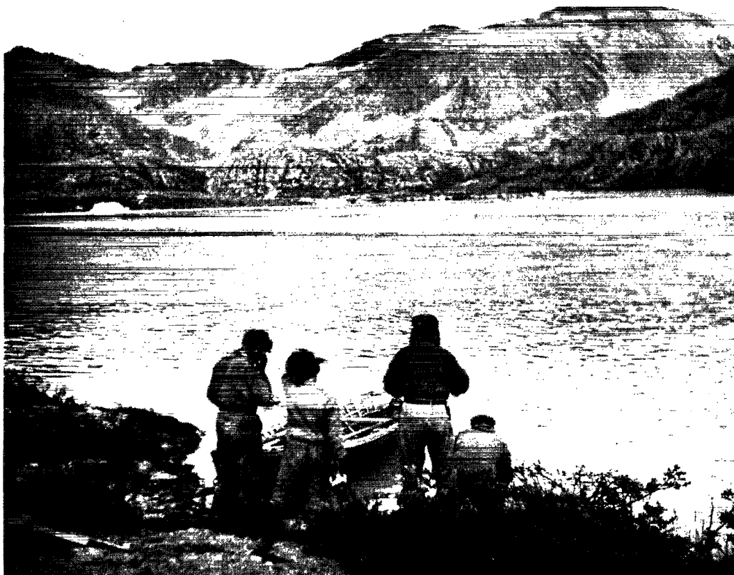
Ved Umivik ved Isuitsoq. Den unge mand til venstre er kommet fra Majorqaq i sejldugsjolle.

våben nok. Det var egentlig ikke for at forhindre dem i at jage; thi når de voksne jægere havde fået fangst nok, gav han de unge lov til at gå på jagt under en erfaren mands ledelse. Under de foregående jagter gav han dem instruktioner om den mest rationelle form for at bære byrder, så at de ikke skulle blive trætte for hurtigt.