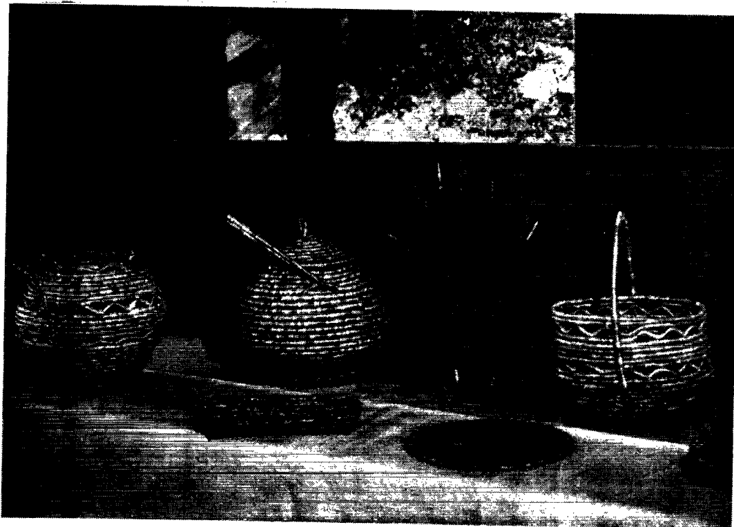
Kurve på disse to sider er lavet af Louise Efraïmsen, Sukkertoppen.