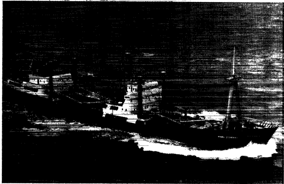
M/S «ANNA JOHANNE»

A/S DET DANSK-FRANSKE DAMPSKIBSSELSKAB København