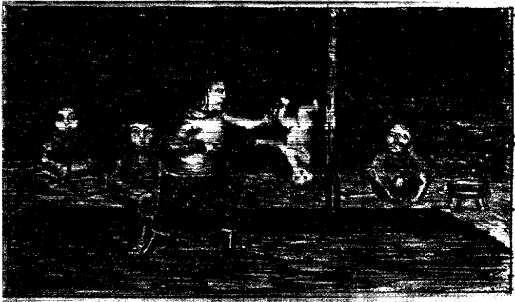
Barnedrab. Lithografi fra sagnet om søskendebørnene. Efter tegning af Aron omkring 1860. Arktisk instituts arkiv.

Den dræbte og gerningsmand kendte hinanden i alle, undtagen eet tilfælde. Det var en episode på baseområdet ved Thule mellem en udsendt dansker og en amerikaner. Disse kendte angiveligt ikke hinanden, men kan meget vel have set hinanden tidligere. I 7 tilfælde skete episoden mellem ægtefæller indbyrdes. 17 tilfælde var børn, der døde som følge af forældres handlinger eller undladelser, og andre 17 tilfælde episoder mellem venner og bekendte. I 2 tilfælde blev forældre dræbt, i et tilfælde en bror.