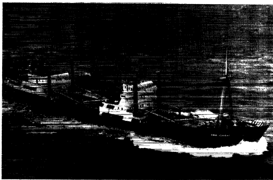
M/S »ANNA JOHANNE«

A/S DET DANSK-FRANSKE DAMPSKIBSSELSKAB København