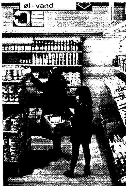
Fot.: Ib Tøpfer (1969).

Med dette in mente er der ingen tvivl om, hvad der lå i det senere forslag om et ændret forhold til Danmarks centraliserede styre af Grønland.