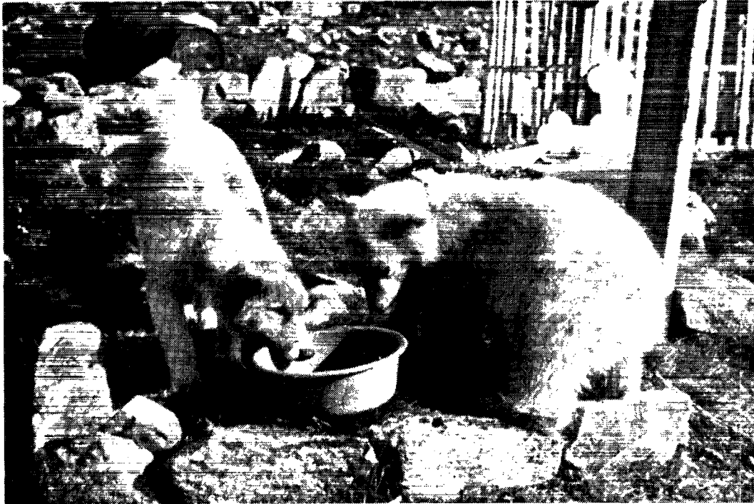
Endnu er der nok til dem begge.