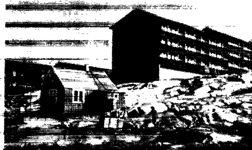
Mennesket og fremskridtet.

Tilbage står nu konsekvenserne af afstemningsresultatet, der som første facit fik Grønland indlemmet i EF; og det er disse konsekvenser, som fik Moses Olsen til at fremkomme med forslaget om en ændring af Grønlands stilling indenfor det danske rige. Perspektiverne af disse konsekvenser berørte dagbladet Information på følgende måde: „Hvis Grønland ikke vil nøjes med at være et amt, men vil have en særplacering ligesom