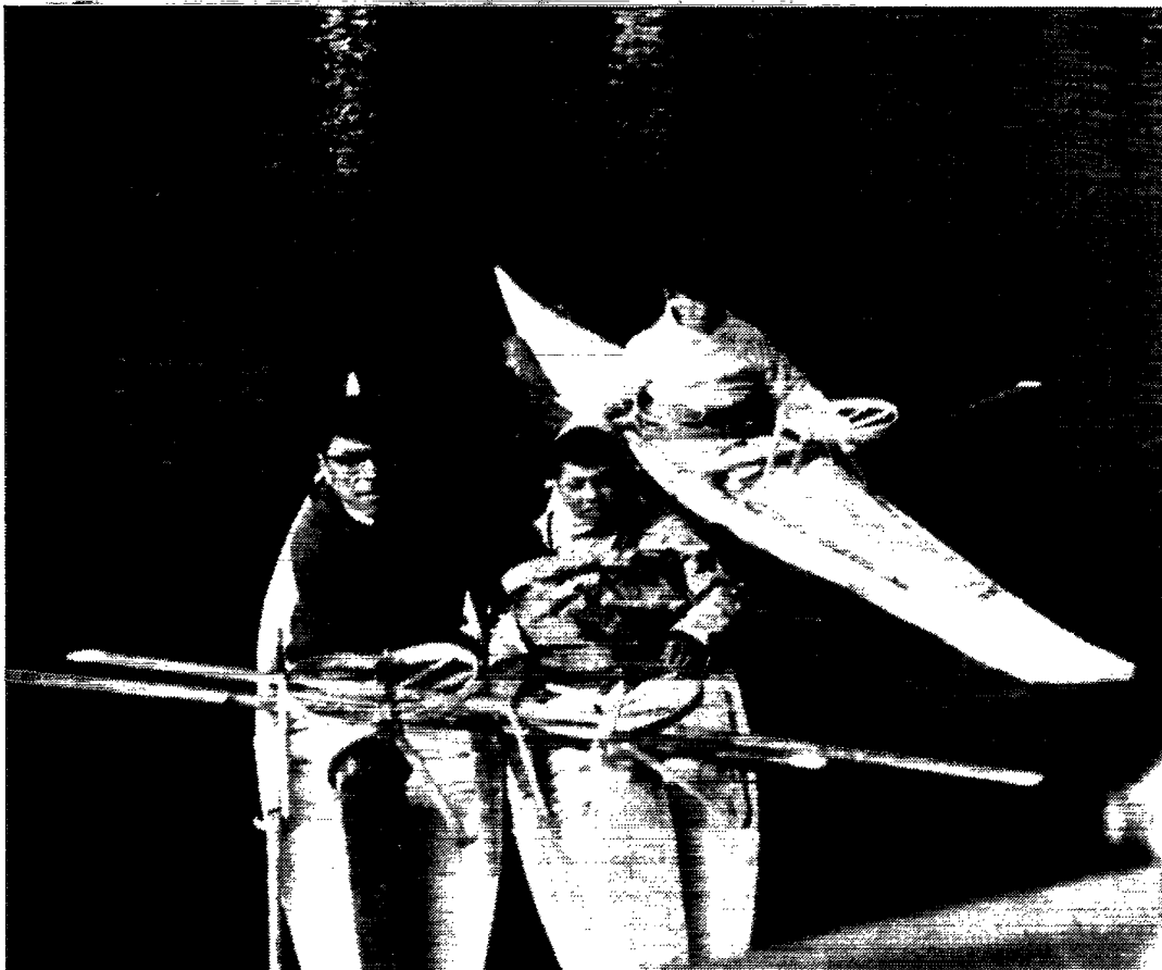
„Når man mærker, at øvelserne er ved at give resultater, får man lyst til at gå videre, hvad enten det drejer sig om orgelspil eller at ro i kajak.“ Her: Kajakundervisning i Umanak.

orgelspil betød nemlig meget i sangundervisningen i skolen og i gudstjenesten. De, der var gået ind til kateketergningen, uden at de helt magtede orgelspil, følte dette som et stort handicap. Men når man mærkede, at øvelserne var ved at give resultater, fik man lyst til at gå videre, – faktisk den samme lyst, man følte, når man var ved at beherske kunsten at ro i kajak. Personligt var jeg bedre til violin end til orgel, og jeg foretrak at spille violin efter noder. Jeg øvede mig gerne hjemme i mit hus, men