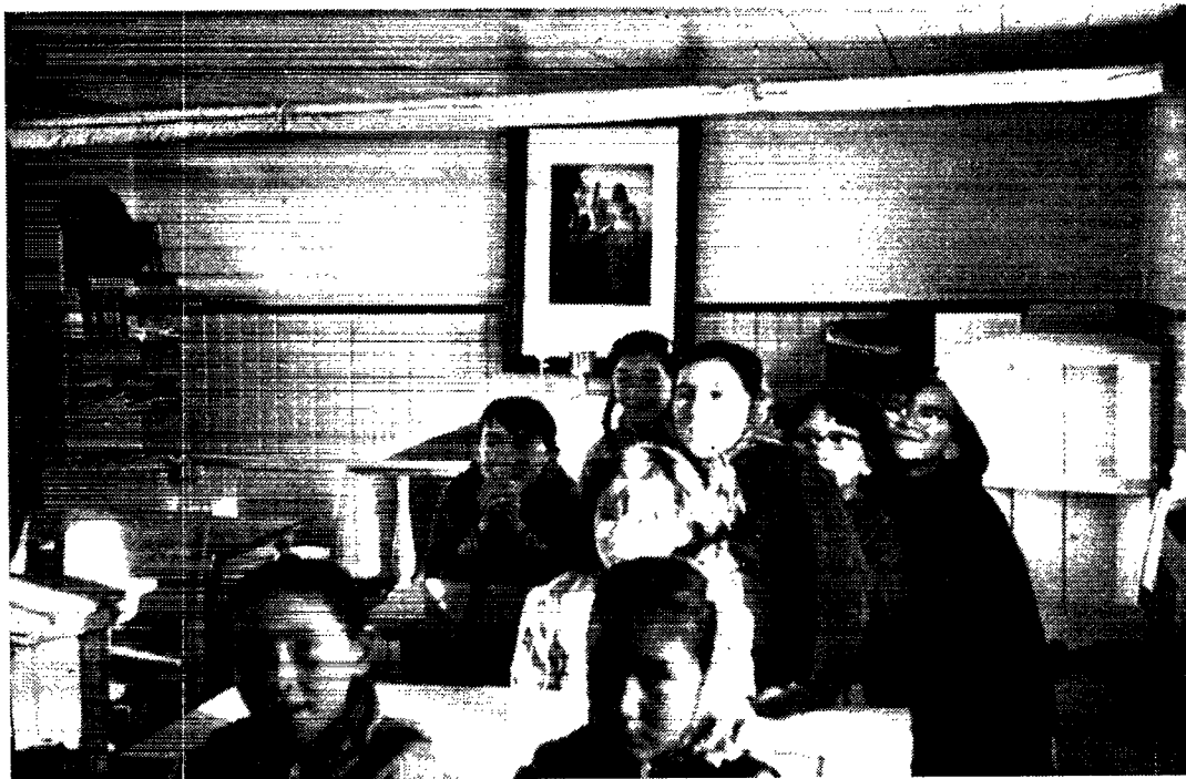
Elever i skolekapellet i den nu nedlagte bygd Skansen på Disko Øen.