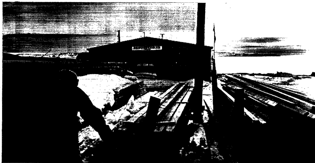
Skipperkolen i Grønland.