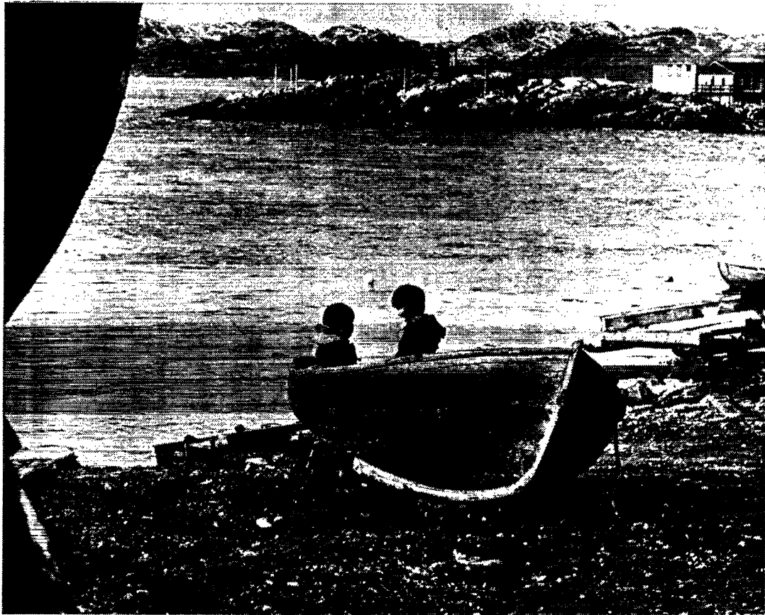
Fremtidens skippere drøfter næste rejse med jollen.