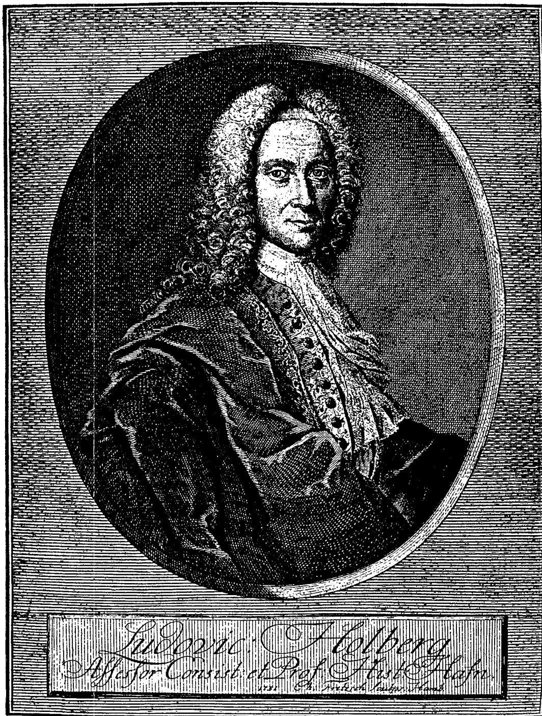
Ludvig Holberg i 1731, kort tid efter at han var blevet professor i historie og var gået i gang med sit historiske hovedværk, Danemarks Riges Historie , som udkom i 1732, 33 og 35.