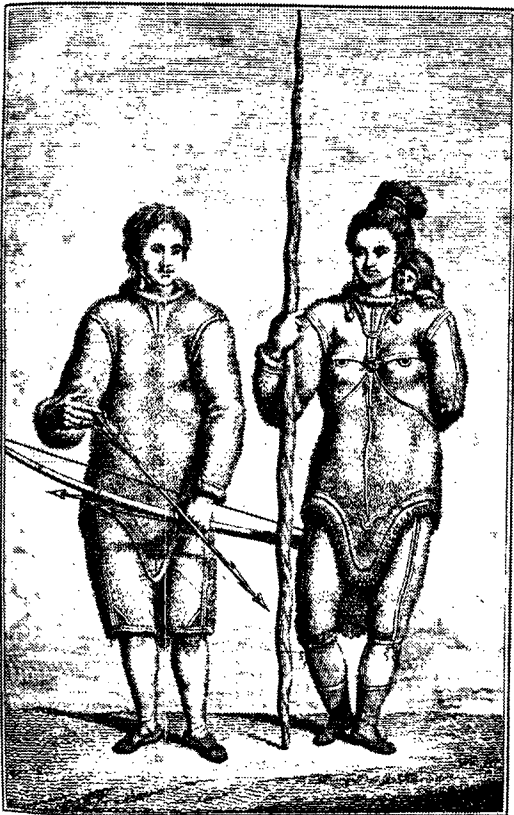
Grønlandere i 1700-tallet. Fra Poul Egedes „Efterretninger om Grønland“, 1788.

og det gode et dialektisk forhold, men dette blev dog ikke i Holbergs lod at påvise.