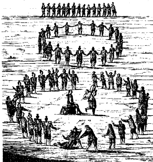
Sangkampscene gengivet i Hans Egedes Perustration fra 1741. I Holbergs Niels Klim, udgivet samme år, bliver det grønlandske forbillede til: „Da de ingen vaaben havde og var ukendt med brugen af dem, sloges de udelukkende med skældsord og forhaanelser ... naar man har klarlagt deres misgerninger, bliver de slæbt hen paa torvet for dér at gøres til genstand for skældsord og forhaanelser.“

I 1741 udkom på latin romanen „Niels Klims underjordiske Rejse“ trykt i Leipzig (for at undgå den danske censur). Det var et slet skjult angreb på den pietisme, som grev Zinzendorf havde introduceret i Danmark og vundet Christian VI for, som havde lukket teateret i København, og som snart efter var blevet statsreligion. Bogen fik en vid udbredelse som en følge af sin latinske sprogdragt, vakte et voldsomt postyr i gejstlige kredse, og udkom i årene derefter på tysk, hollandsk, fransk, engelsk, dansk, svensk, russisk og ungarsk. Kritikken af samtidens intolerance lader Holberg i romanen komme til udtryk