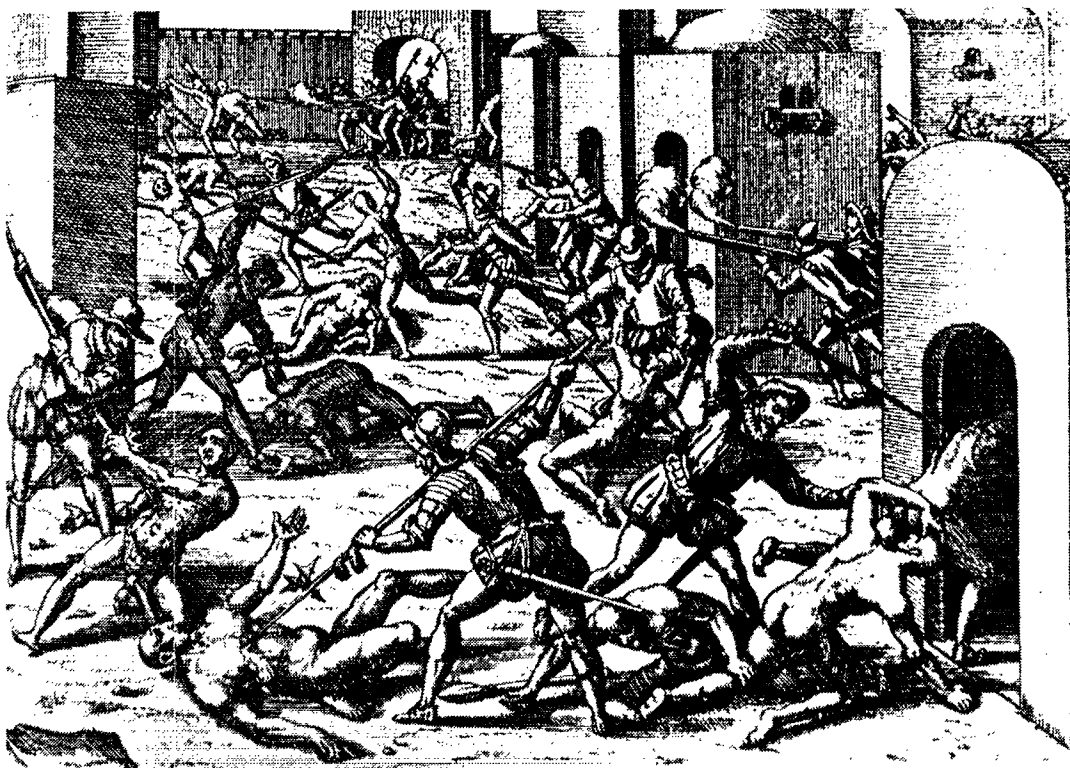
„Da en anden hørte fortælle om de store Nederlag, som de Christne havde gjort i America, sagde han: Det er Lykke, at vi beboe et fattigt Land; thi ellers havde det ikke gaaet os bedre.“ Illustration fra Pizarro's erobring af Inka-hovedstaden Cusco i 1533, British Museum.

fornuftige. Han gav dem en bevidsthed, som kan ræsonnere uden at have lært noget om syllogistiske metoder. Det er ikke ved hjælp af dem, forstanden har lært at ræsonnere“ (p. 214). Disse tanker genfindes hos Holberg og er egentlig ganske kulturrelativistiske i vor forstand.