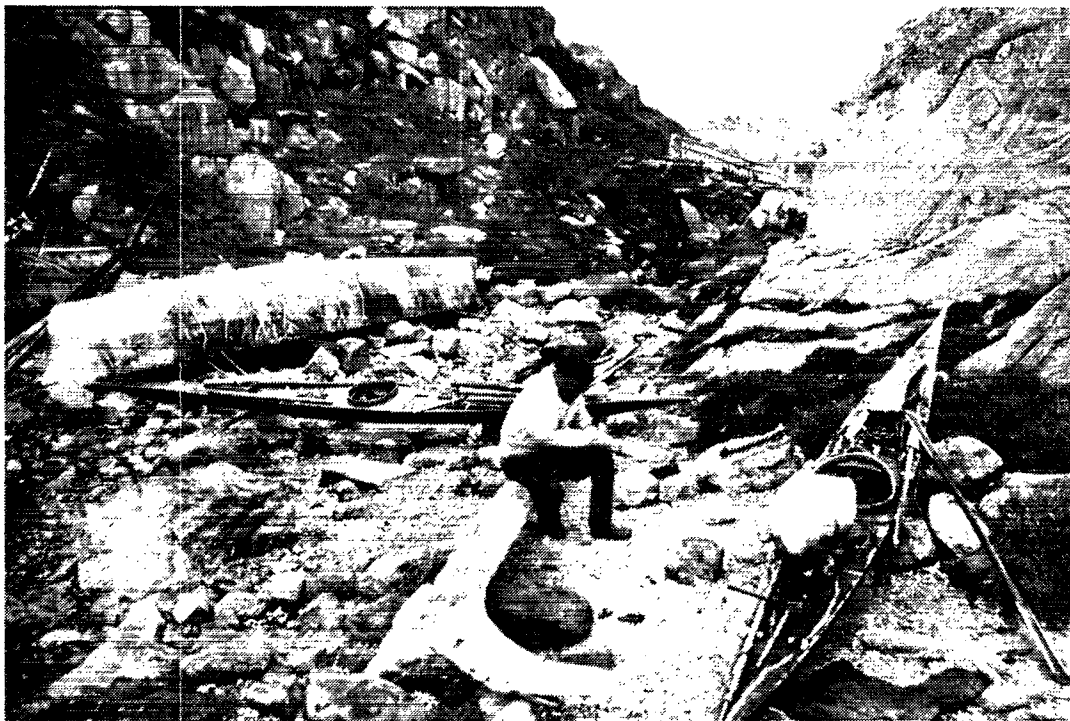
Julianehåb distrikt 1914.