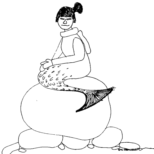
Tegning: Jan Granquist.

medgjorte bliver grønlænderne overfor dette forhold.